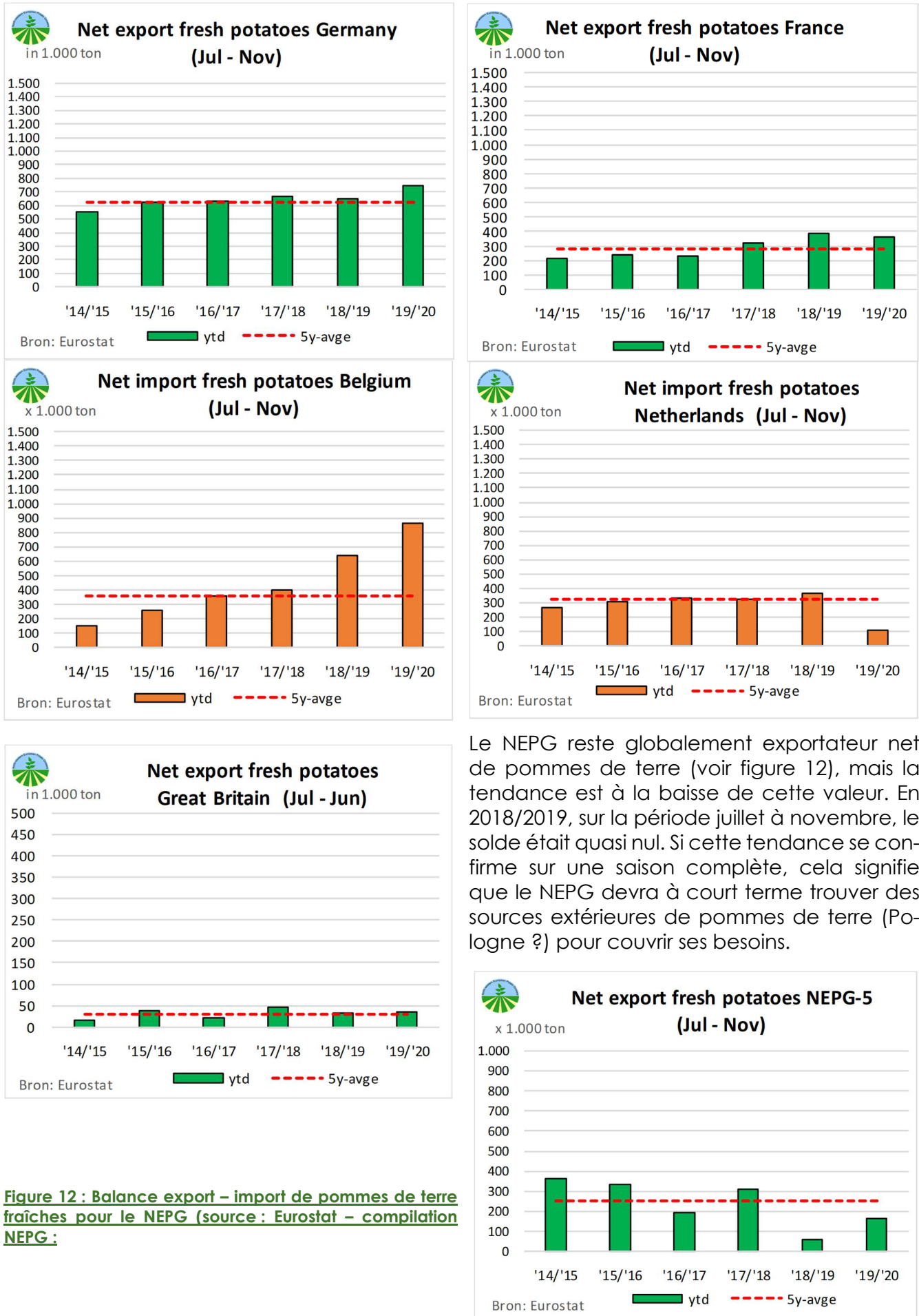
Figure 11 : Balance export – import de pommes de terre fraîches pour chacun des pays NEPG :

Le NEPG reste globalement exportateur net de pommes de terre (voir figure 12), mais la tendance est à la baisse de cette valeur. En 2018/2019, sur la période juillet à novembre, le solde était quasi nul. Si cette tendance se confirme sur une saison complète, cela signifie que le NEPG devra à court terme trouver des sources extérieures de pommes de terre (Pologne ?) pour couvrir ses besoins.