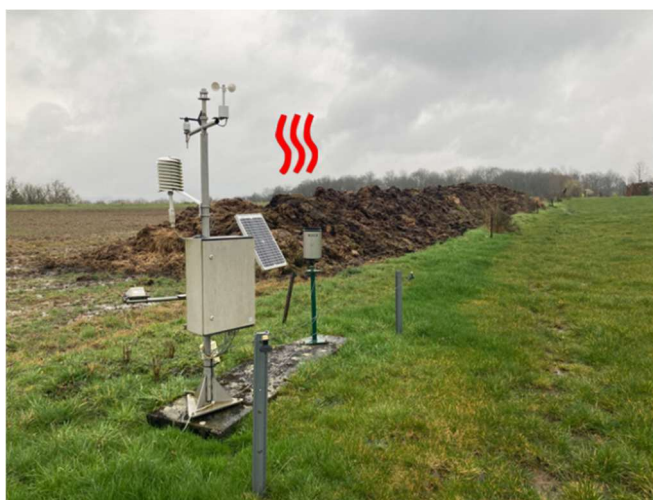
Photo 1 et 2 : Exemples de mauvais emplacements des stations (proche de l'asphalte et proche d'un tas de fumier qui faussent les températures)