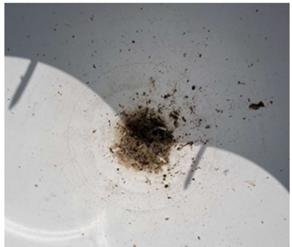
Photo 3 et 4 : Attention au bouchage du pluviomètre

A chaque changement de saison culturale, nettoyer l'abri anti-radiatif (pour la température et l'humidité), le pluviomètre, le panneau solaire et le capteur d'ensoleillement. Cela permet de démarrer chaque saison avec un équipement optimal.